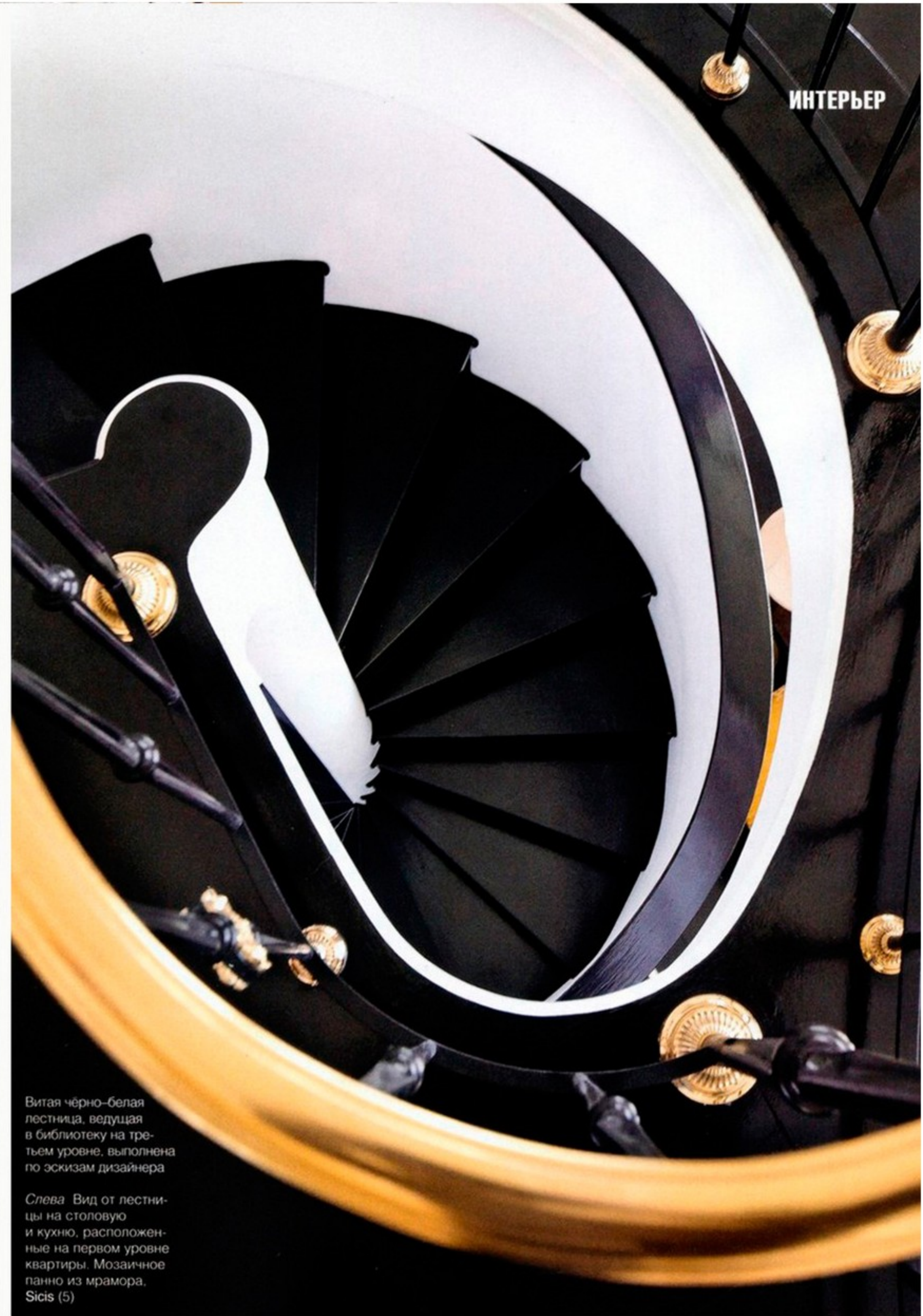
Витая чёрно-белая лестница, ведущая в библиотеку на третьем уровне, выполнена по эскизам дизайнера